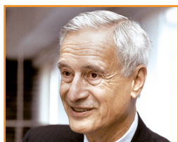
ROBERT KAPLAN Docente HARVARD BUSINESS SCHOOL